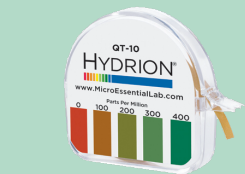
Quat Tiras de prueba Item 421200