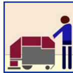
Auto Scrubber Depurador Auto