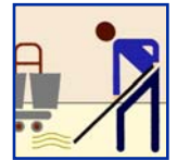
Mop & Bucket Mop y Cubo