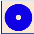
Floor Pad – Blue Cojín Del Piso - Azul