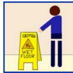
Wet Floor Signs Precaución - Piso Mojado