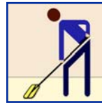
Dust Mop Mop del Polvo