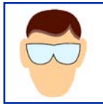
Safety Glasses Gafas de seguridad