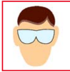
Safety Glasses Gafas de seguridad