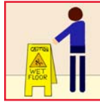
Wet Floor Signs Precaución - Piso Mojado