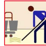
Mop & Bucket Mop y Cubo