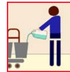
Cleaning Chemical Producto químico De la Limpieza