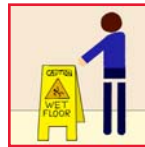
Wet Floor Signs Precaución - Piso Mojado