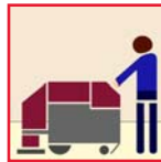
Auto Scrubber Depurador Auto