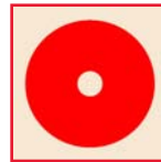
Floor Pad - Red Cojín Del Piso - Rojo