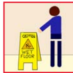
Wet Floor Signs Precaución - Piso Mojado